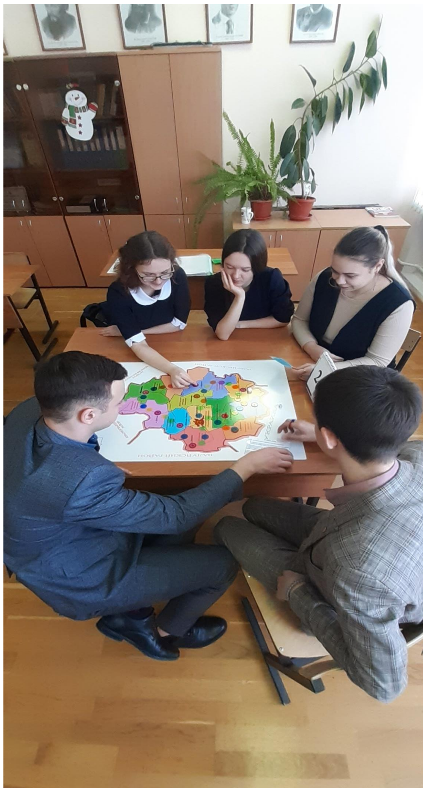
Проведение игры «Мой родной Вейделевский край»