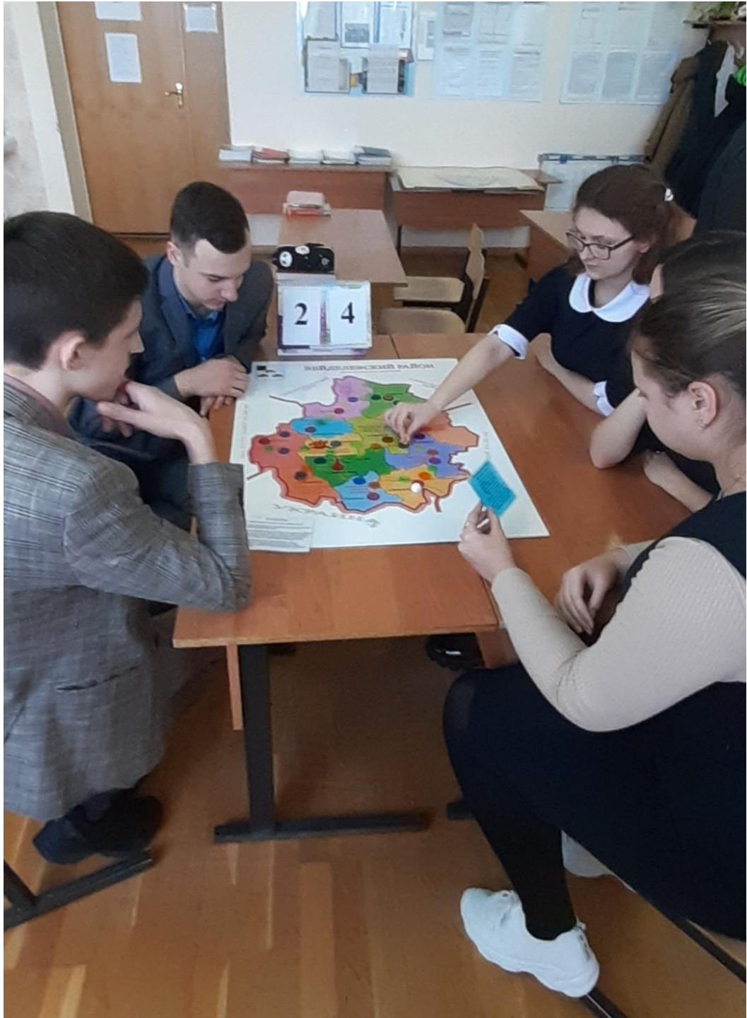
Проведение игры «Мой родной Вейделевский край»