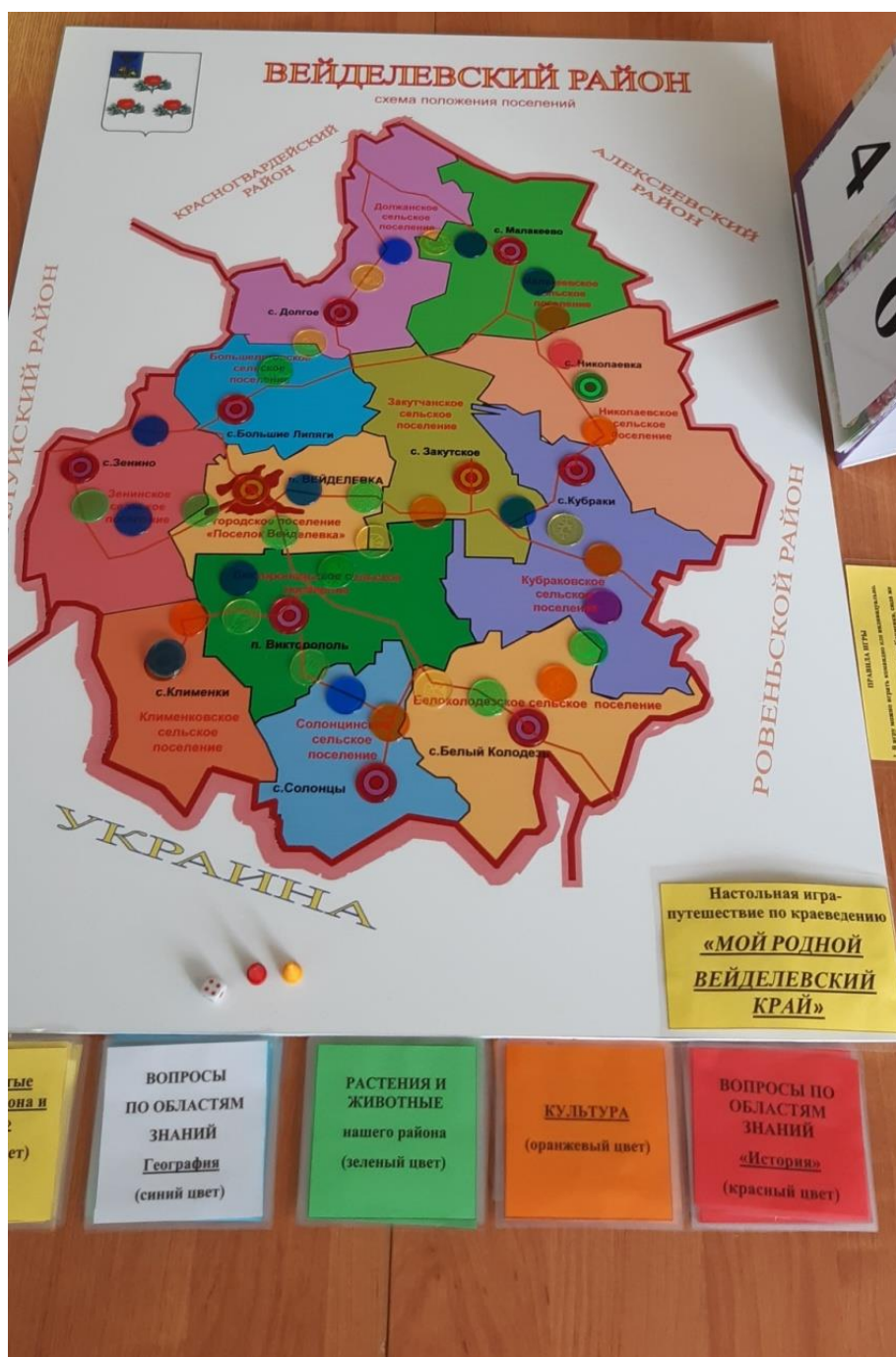
Общий вид настольной игры